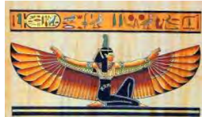
Nella Terra di Kemi

La vastità degli argomenti e la qualità degli studi affrontati fanno della rivista KEMI HATHOR una collezione unica, una sintetica e moderna biblioteca alchimica, e i tesori di sapere che raccoglie costituiscono un riferimento sempre più prezioso nel tempo. L'Archivio Kemi mette a disposizione di chi desidera completare la collezione i singoli fascicoli arretrati in originale e le ristampe dei numeri esauriti. La raccolta completa dei 126 numeri pubblicati è ora disponibile ad un prezzo complessivo di Euro 550, solo Euro 4,35 a fascicolo.